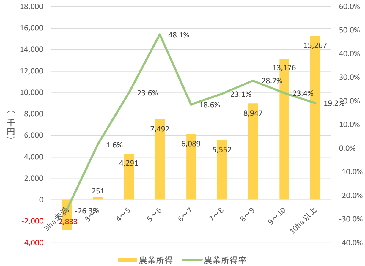
経営畑面積規模階層別の農業所得