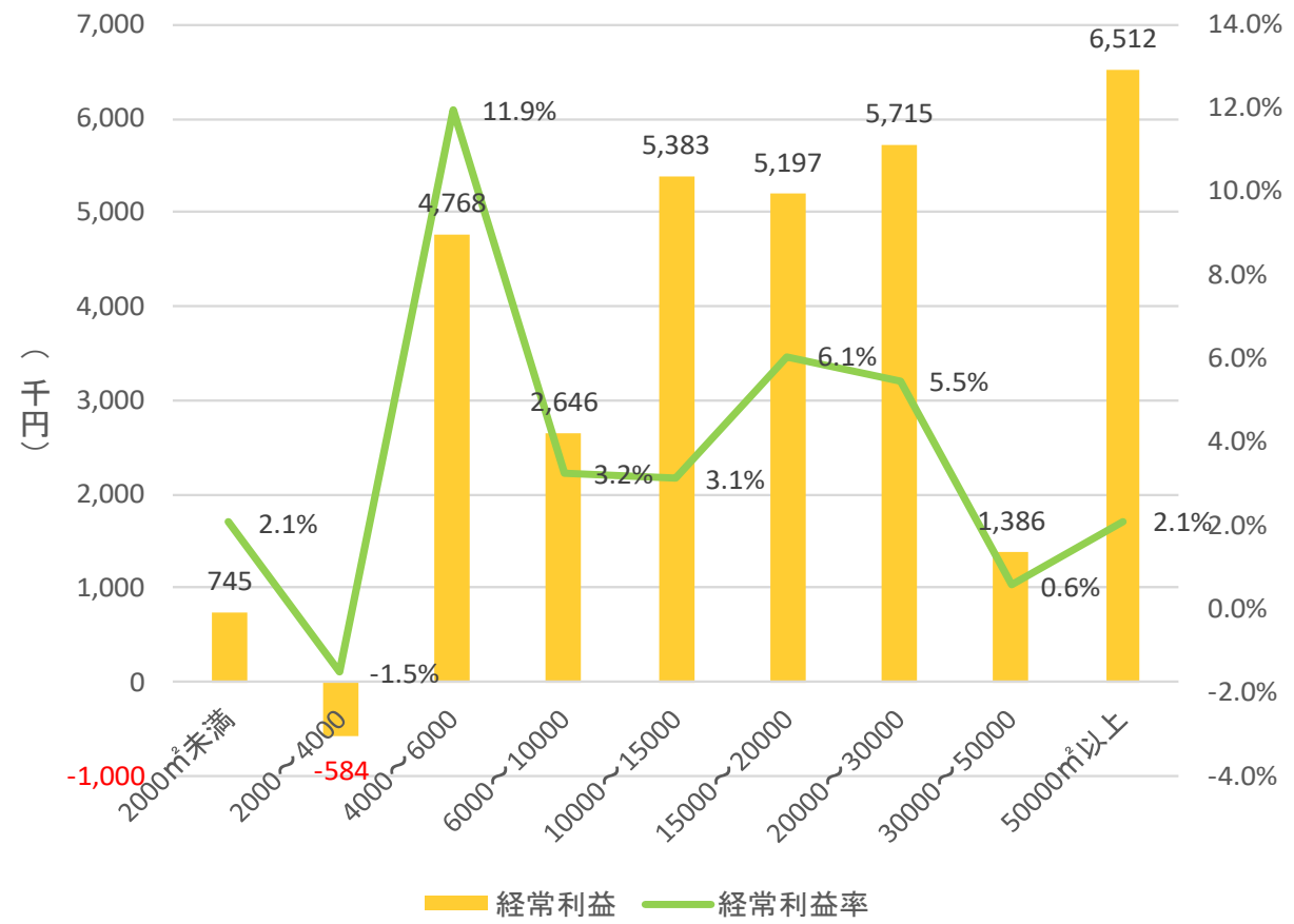
経営施設面積規模階層別の経常利益